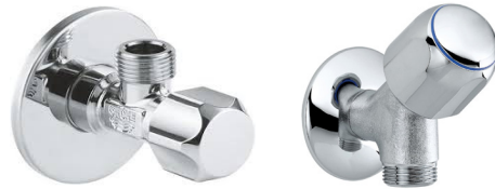
Beispiel für ein Wasseranschluss